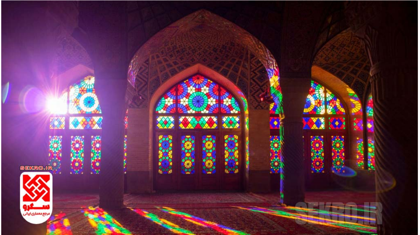
مسجد نصیر الملک شیراز، مسجد صورتی