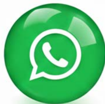
واتس آپ سکرو